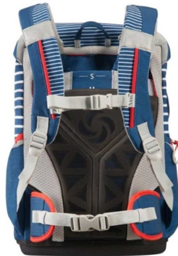
Vergleichbares Rückensystem der Gregory Bergsport-Serien Paragon und Maven.