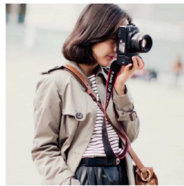
Park & Cube | Design Shini Park