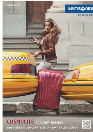
Anzeigenmotiv 2013 / 2014

Samsonite®, das weltweit führende Unternehmen für Reisegepäck, setzt in diesem Jahr die „Enjoy Every Second“-Kampagne mit neuen, an die Kampagne 2013 anknüpfenden Motiven und Videos fort. Die letztjährige, von Saatchi & Saatchi Brüssel entwickelte multi-mediale Strategie war in Konzeption und Umsetzung sehr erfolgreich und wurde von der Agentur für 2014 mit Fokus auf die neue Kollektion Lite-Locked™ weiter entwickelt. Im Rahmen der „Samsonite By Your Side“-Kommunikationsstrategie läuft die Kampagne seit Jahresanfang europaweit und multimedial mit Videos, TV-Spots, Print- und Online-Anzeigen sowie POS-Materialien; in Deutschland wird Samsonite ab dem 5. Mai 2014 Print- und Online-Werbung schalten - sowohl mit dem neuen Anzeigenmotiv für die Serie Lite-Locked als auch mit dem für die Serie Cosmolite aus dem letzten Jahr.