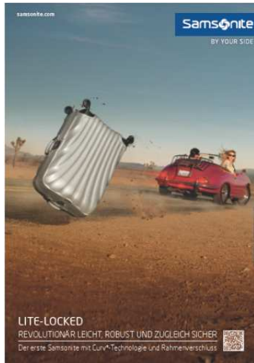
Neues Anzeigenmotiv 2014

Samsonite setzt Multi-Media Kampagne 2014 mit neuen Motiven und Videos fort In Deutschland schaltet Samsonite ab Mai Print- und Online-Werbung